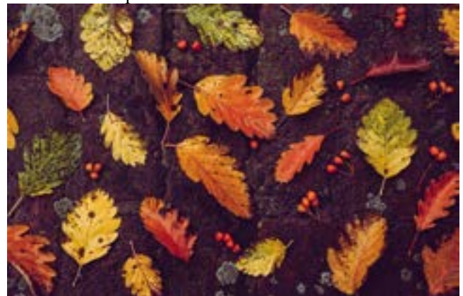
Herbstliches Programm in der Obstwerkstatt