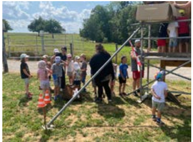
Die Kinder warteten geduldig bis Sie auch auf das Gerüst durften um das Insektenhotel zu befüllen