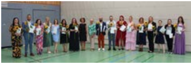
Der Jahrgang 2023 der Pflegefachfrauen und -männer