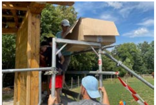
Befüllen des Insektenhotels