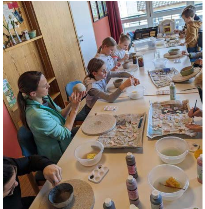
Töpfern am 15.03.2023

Anmeldung möglich für Mai unter: 07471/9979-0 oder wild@rangendingen.de