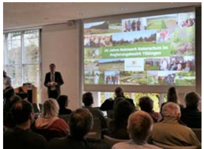
Regierungspräsident Klaus Tappeser bedankt sich für 20 Jahre vernetzte Naturschutzarbeit; Fotografie: Katrin Rochner.

Zielsetzung der Netzwerkarbeit ist das Angebot einer Kommunikationsplattform, die Information und Austausch zu aktuellen und regionalen Naturschutzthemen im Regierungsbezirk Tübingen „auf Augenhöhe“ ermöglicht und die Vernetzung der Teilnehmenden unterstützt. Der Schwerpunkt liegt dabei auf dem persönlichen Austausch. Die Veranstaltungen des Netzwerks Naturschutz sind in der Regel kostenfrei und es wird keine Tagungsgebühr erhoben.