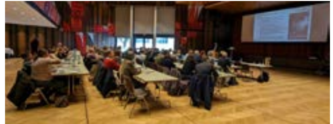
Teilnehmerinnen und Teilnehmer der AGLR-Fachtagung.