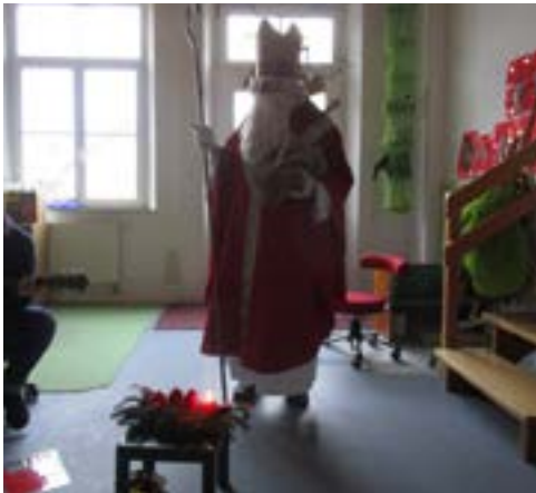
Der Nikolaus kommt in den Kindergarten