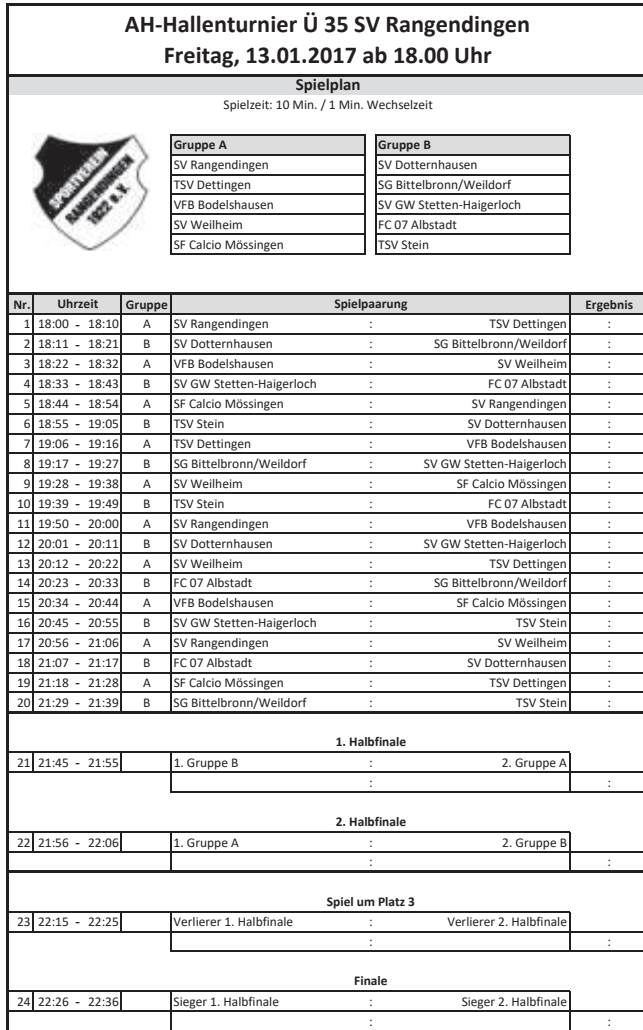
2017 Spielplan Ü 35 AH-Hallenturnier 2x5 Mannschaften