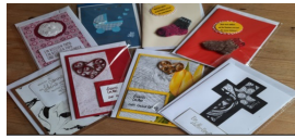
Handarbeitstreff 03.05. ab 14 Uhr

Montag, 13. Mai: Ab 14.00 Uhr Marktcafé im Ev. Gemeindehaus