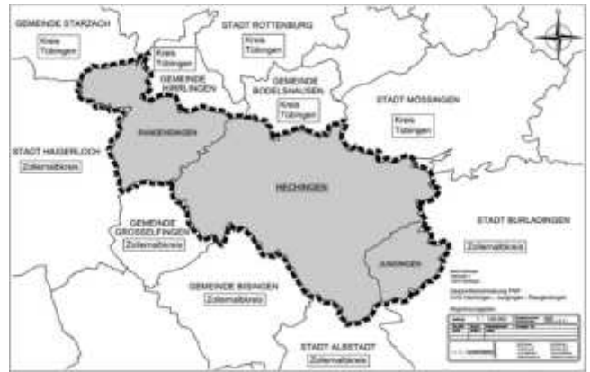
Abgrenzungsplan, Büro Gfrörer, Empfingen, vom 26.09.2017

Gemeinden Hechingen, Jungingen und Rangendingen. Dieses ergibt sich aus dem folgenden Abgrenzungsplan: