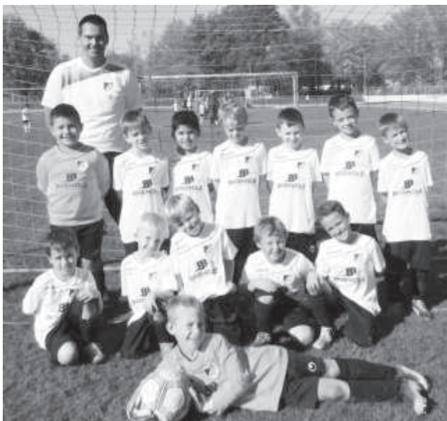
Die F-Jugend hat mit zwei Mannschaften an den Spieltagen in Weildorf, Trillfingen und Hechingen teilgenommen. Insgesamt hatte jede Mannschaft 8 Spiele.